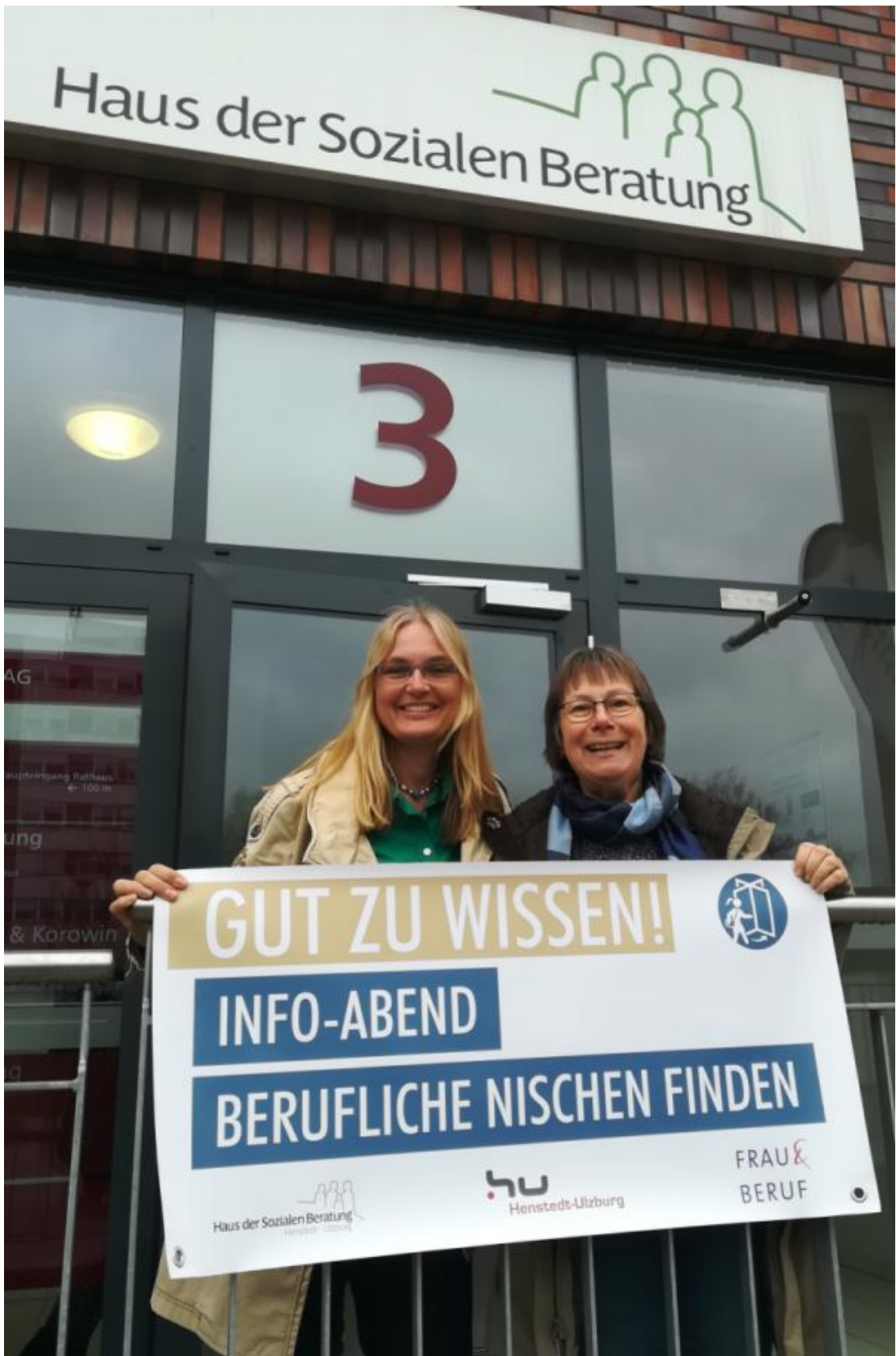
Manchmal ist es einfach gut, im Vorwege informiert zu sein. „Gut zu wissen!“ heißt deswegen die