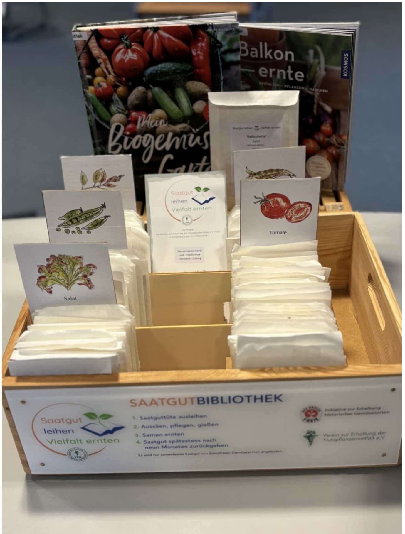
Ab dem 17. Februar besteht wieder die Möglichkeit, in der Gemeindebücherei und -mediothek Henstedt-Ulzburg, Hamburger Straße 22a, Saatgut von „Alten Sorten“ auszuleihen. Im Angebot sind verschiedene Sorten von Erbsen, Tomaten, Bohnen, Salaten und Melden. Es ist bereits das vierte Jahr, in dem die